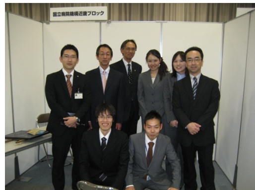
就職説明会終了後、全員で

今回の就職説明会は、私自身にとっても就職当初の原点に立ち返る良い機会となりました。今春よりいよいよ6年制の卒業生が社会に出きます。薬剤師の資質が試される時期でもあると思いますので、より一層気を引き締めて業務に邁進していきたいと思っております。