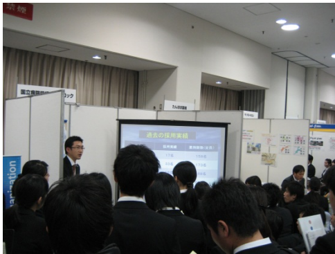
ブース内での説明会の様子

めでいしーんフォーラムは（株）ジェイブロード主催の薬学生対象の合同就職セミナーで、大阪の他にも全国各地で開催されています。今回のめでいしーんフォーラム大阪は、12月18日、天満橋のOMMビルイベントホールにおいて開催されました。企業ブースとしては主に調剤薬局、ドラッグストア、SMO、病院など32社の参画があり、また企業ブースとは別に、就職活動応援講座や国家試験対策講座、リクルートメイクアップ講座、業界研究などの特別講座が用意されていました。広い会場でしたが1000名を超える学生が訪れ、非常に活気に満ちた説明会でした。